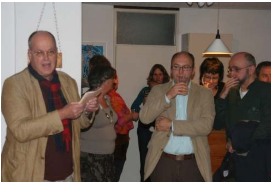
Eén van onze bezoekers draagt een gedicht voor tijdens ons jubileum.

in 2008 een begin gemaakt met het omwerken van al het materiaal tot een schriftelijke vorm. Dit is niet makkelijk, omdat het geven van de cursus maatwerk is. De uiteindelijke vorm wordt steeds weer afgestemd op de kerkelijke gemeente en de omgeving waarin zij zich bevindt.