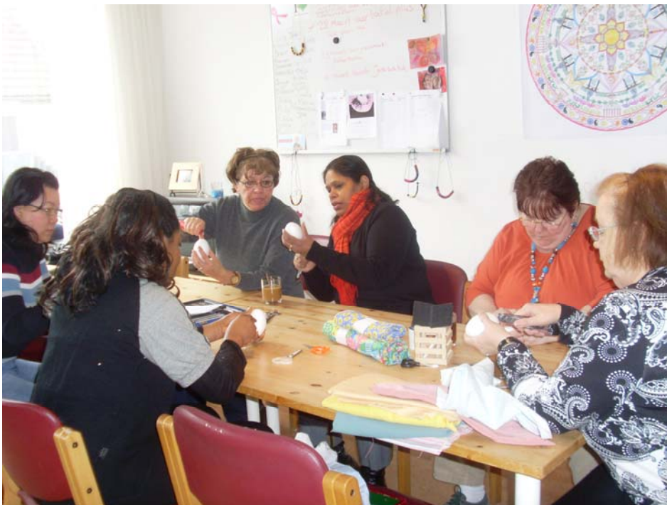
Het Intercultureel Atelier in actie

Er is intensief contact geweest met diverse doopsgezinde en burgerlijke organisaties. Het doel was het werk van het inloophuis meer onder de aandacht te brengen.