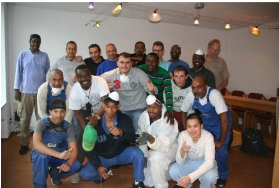
De mannen van Mitsubishi

Op 17 mei is er een klusdag georganiseerd waarbij er 20 mannen van Mitsubishi klussen in De Ruimte hebben helpen uitvoeren.