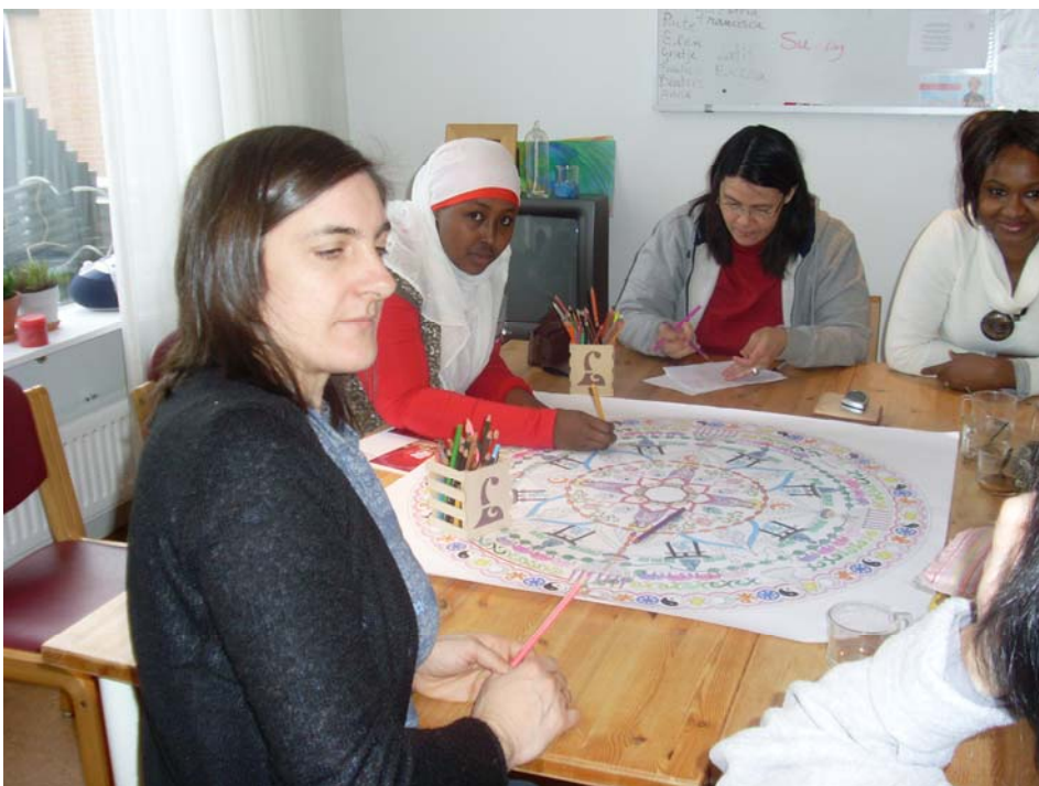
Een workshop van het Intercultureel Atelier in De Ruimte

http://www.netwerkurbanmission.nl/index.php/icb-centraal