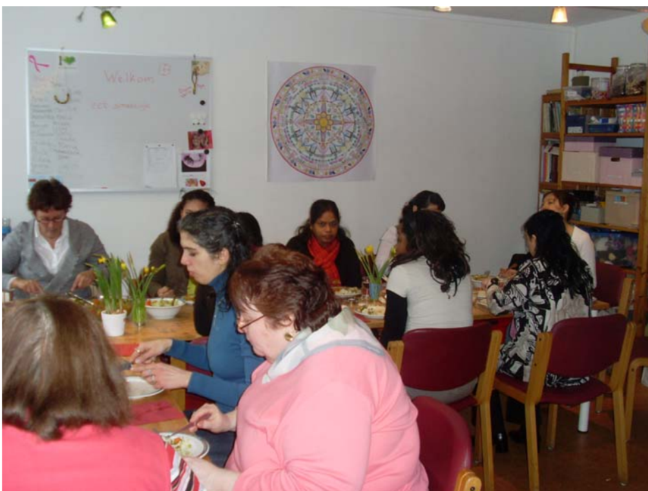
Een gemeenschappelijke maaltijd op het Inloophuis